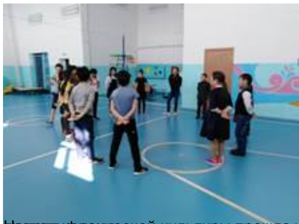
Неделя физической культуры прошла успешно, дети весело и с пользой для здоровья