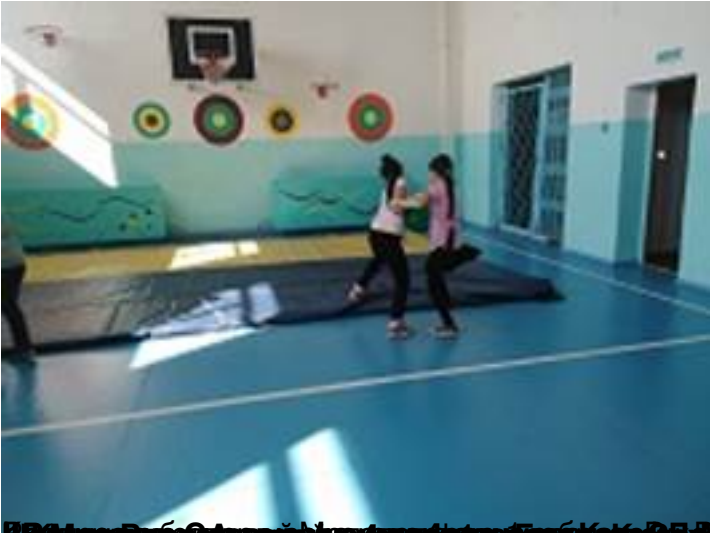
В спортзале учащиеся и преподаватели провели занятия по танцу.